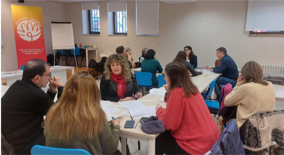
Imagen 2- Momento de trabajo en grupos