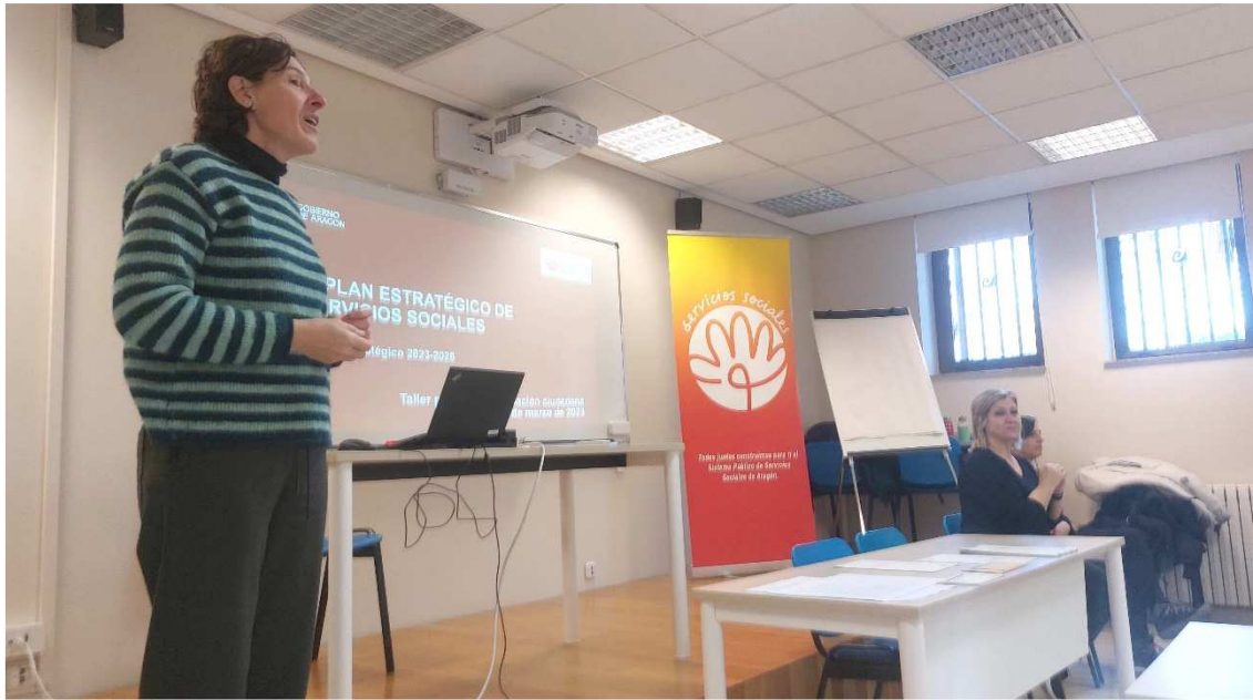
Imagen 1- Encuadre de la sesión